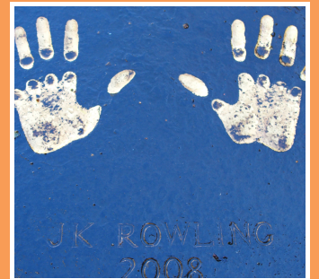
L'emprunte des mains de J-K Rowling.

J. K. Rowling, de son vrai nom Joanne Rowling, est l'auteur de la saga Harry Potter.